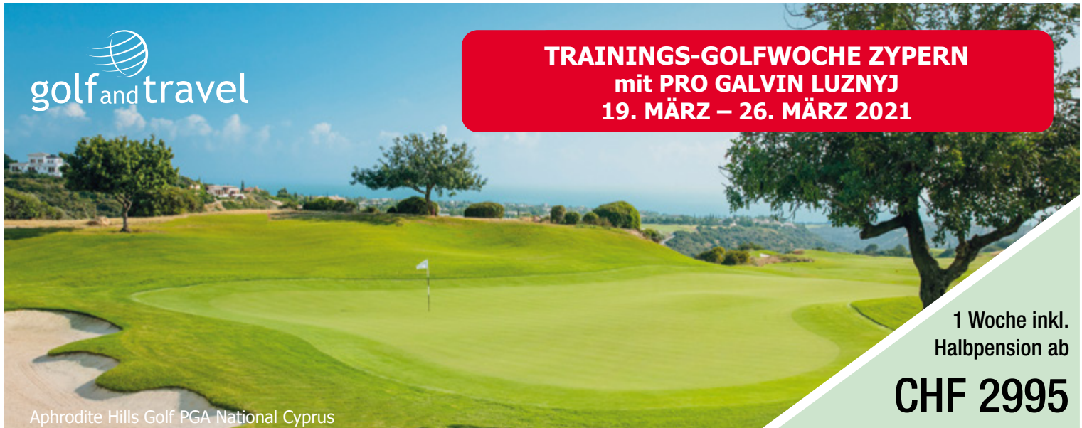
Aphrodite Hills Golf PGA National Cyprus