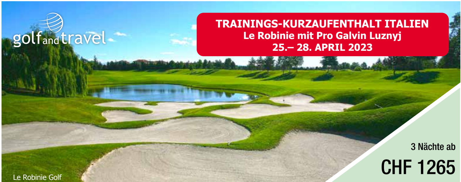
Le Robinie Golf