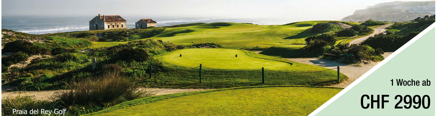
Praia del Rey Golf